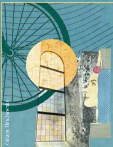
Collage: Tina Zarembo