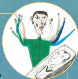
Illustration: Kamilla Stocinska

/ 4.-6. klasse / Sept.-nov. 2023 / 6-9 lektioner / Kristendomskundskab og billedkunst