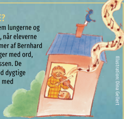
Illustration: Dina Gellert

/ 1.-3. klasse / Aug.-okt. 2023 / 8-10 lektioner / Musik, dansk og kristendomskundskab